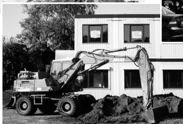
Lauter Aufnahmen aus den Sommerferien, als der heutige Bauzustand (Container-Trakt) noch nicht erreicht war.