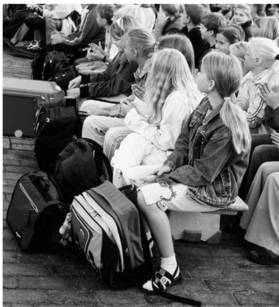
Sooo kleine Mädchen mit sooo großen Schultaschen! Bilder von der Open-Air-Begrüßung der neuen Fünftklässler.

Fragen auf, da auf die Entfernung von 15 Kilometern nur ganz vereinzelte Ortswechsel an einem Schulvormittag in Frage kommen.