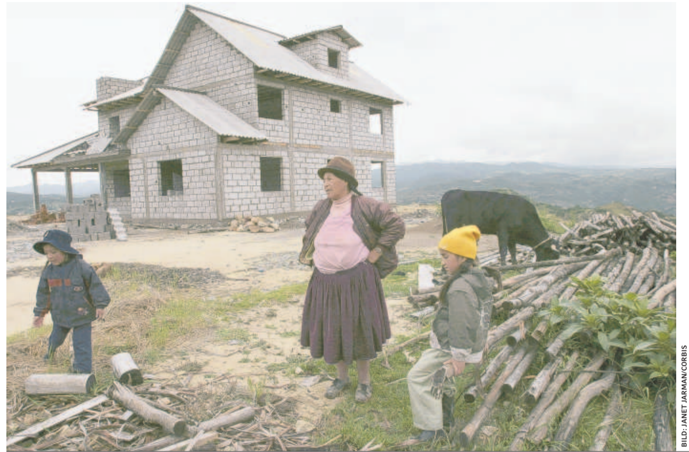
Gelungen: Durch die Geldüberweisungen von Migranten zurück in die Heimat können Angehörige zu bescheidenem Wohlstand kommen.