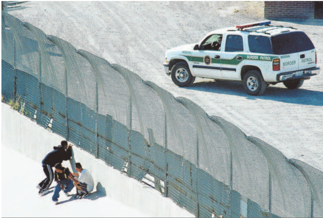
Gescheitert: US-Grenzposten entdecken eine Gruppe von Flüchtlingen, bevor diese die Sperranlagen von Mexiko aus überwinden können.